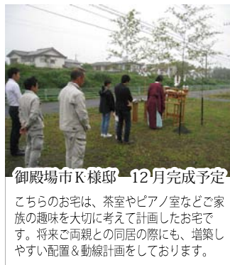
御殿場市K様邸 12月完成予定

海外の素数な住宅のデザインを十分に生か して造る、久し振りの本格輸入住宅です。 ご主人様の通勤路沿いなので、毎日楽しみ に会社に行き来しているそうです。