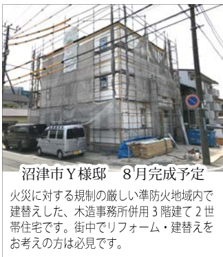
沼津市Y様邸 8月完成予定

火災に対する規制の厳しい準防火地域内で 建替えた、木造事務所併用3階建て2世 帯住宅です。街中でリフォーム・建替えを お考えの方は必見です。