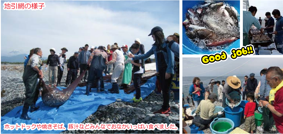
ホットドックや焼きそば、豚汁などみんなでおいっぱい食べました。