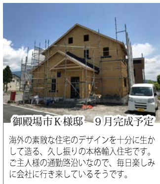
御殿場市K様邸 9月完成予定

火災に対する規制の厳しい準防火地域内で 建替えた、木造事務所併用3階建て2世 帯住宅です。街中でリフォーム・建替えを お考えの方は必見です。